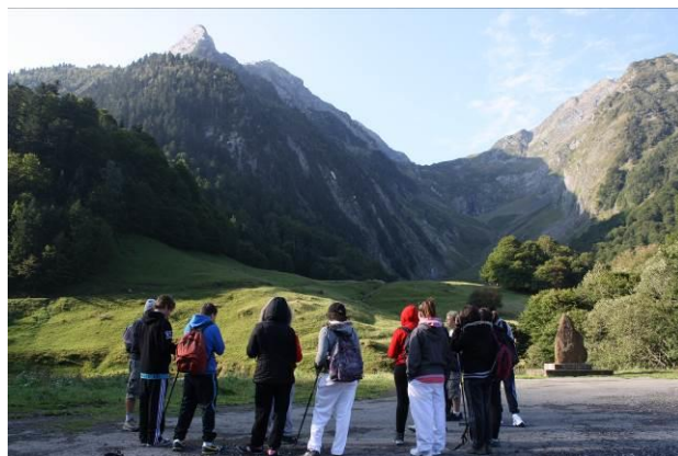
Départ de l'Hospice de France