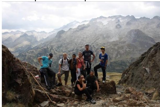
Port de Venasque avec vue sur le massif de la Maladeta

Le soir un repas convivial dans la salle de restaurant avec des enseignants qui sont venus nous rejoindre. La soirée s'est terminée autour d'un feu de camp et la lecture de contes.