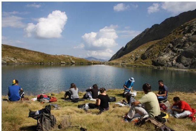
Repas du midi au bord du lac des Boums